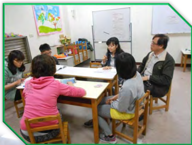
顧問對 SuperSkills 老師教學進行諮詢輔導