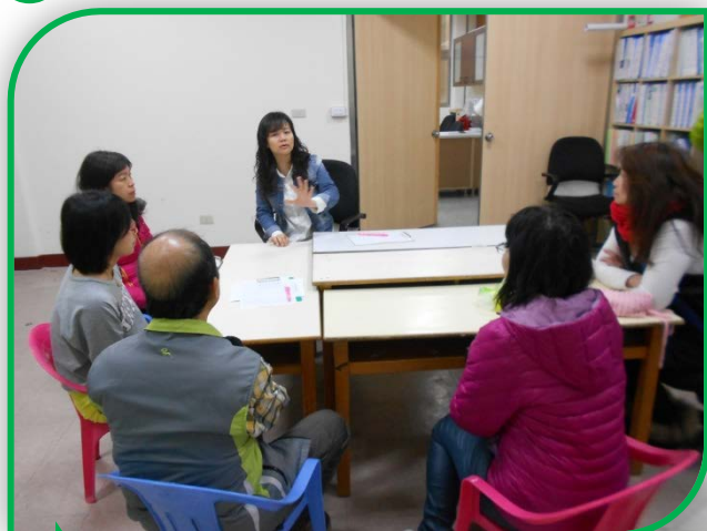
顧問與青少年班家長會談

特開此專欄以收錄彙整 Super Skills 社交技巧團體課程之顧問、老師及家長一年多來的感想與心得，將陸續於會訊中刊載，希望透過篇篇精彩的心得分享，讓大家對 Super Skills 社交技巧團體課程有更深入的認識與瞭解。