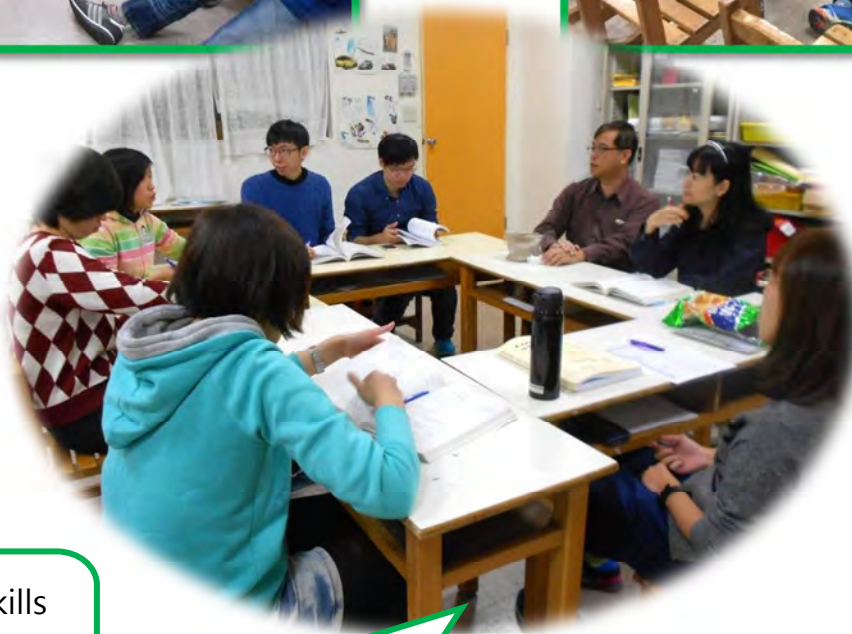
SuperSkills 青少年班上 課情形