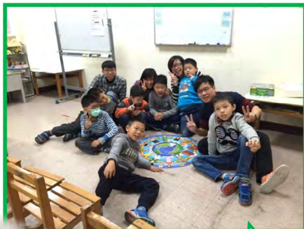
SuperSkills 兒童 B 班上 課情形