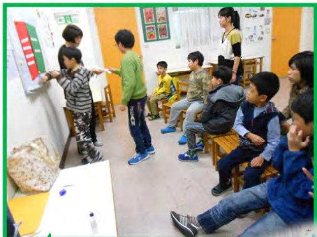
SuperSkills 兒童 A 班上 課情形

本專欄除了持續收錄 Super Skills 社交技巧團體課程之顧問、老師及家長的感想與心得外，同時歡迎本課程兒童班或青少年班的學員來投稿(如:文章、漫畫...)，希望透過孩子的圖、文分享，瞭解他們的內心世界，也讓本專欄更豐富有趣~~。