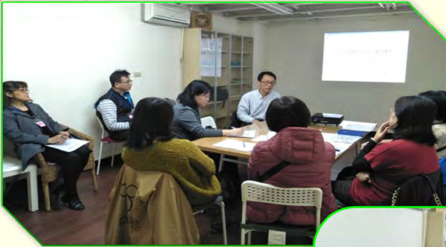
(簡宏生老師與家長們互動~)