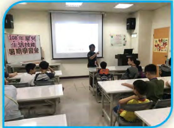
↑ 老師說明課程活動