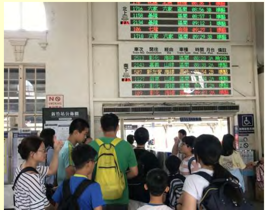
↑ 學習看時刻表搭火車