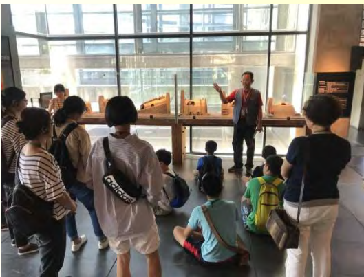
↑ 參觀鶯歌陶瓷博物館