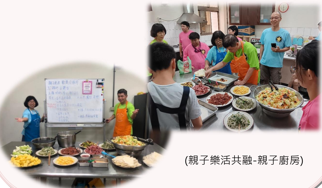
(親子樂活共融-親子廚房)